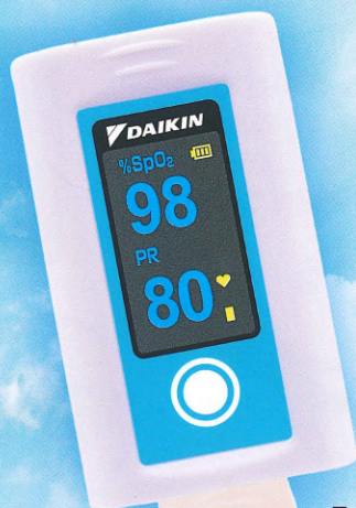
ライトブルー 原寸大です