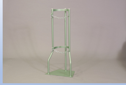
ボンベスタンド 7000L 用