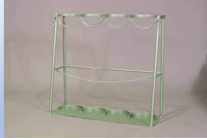
ボンベスタンド 7000L4 本立て用