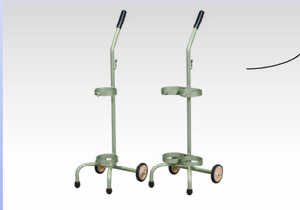
ボンベカート 500L(1 本用・2 本用)

ボンベカートのカラーは、パープル・ブルー・ホワイト・ピンク・グリーンの 5 色から選べるタイプもございます。病棟・病室・外来などで色分けすることも可能です。 ストッパー付きの 4 輪のカートなどもご案内できます。 ボンベの転倒事故防止のためにも、保管時は容器立てに、移動の際はカートに乗せてください