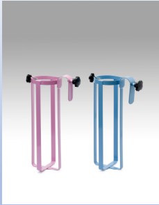
ベッド用ボンベ架