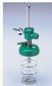
P-324形 ネブライザー式