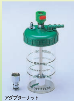
アダプターナット

ワンタッチ式 アダプターナットの装着により、濃縮器・リベレータのどちらにも使用できます。